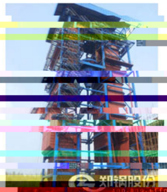
150吨流化床电站锅炉安装现场图片

郑锅五星级的售前、售中、售后服务完美诠释了“心服务，星体验”的服务理念，使得河北东光150吨流化床电站锅炉的安装平稳高效实行。在河北东光150吨流化床电站锅炉后续的安装进度中，郑锅继续在官网“服务支持—跟踪服务”栏目、官方微信、微博详细介绍，同时您还可以拨打全国免费咨询热线400-839-1110了解更多郑锅服务体系。